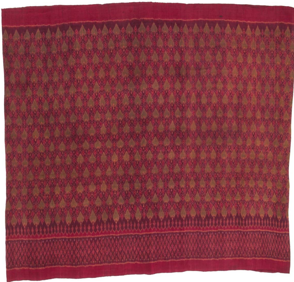
ลายใบโพธิ์

ลายใบโพธิ์ เรียกตามลักษณะของลวดลายที่เปรียบเทียบกับใบโพธิ์ ซึ่งเป็นใบของต้นพระศรีมหาโพธิ์ อันเป็นโพธิพฤกษ์ที่สมเด็จพระสัมมาสัมพุทธเจ้าประทับใต้ร่มเงา และตรัสรู้ในเวลาต่อมา ลักษณะเป็นลวดลายที่มีมาแต่โบราณกาลในราวปลายรัชกาลที่ 5 ถึงต้นรัชกาลที่ 6 เป็นต้นมา โดยสันนิษฐานว่า รูปแบบลวดลายน่าจะมีที่มาจากประเทศอินเดีย และด้วยลวดลายที่มีลักษณะคล้ายกับลายรูปหัวใจ บางคนจึงเรียกกลายนี้ว่า ลายหัวใจ ด้วย