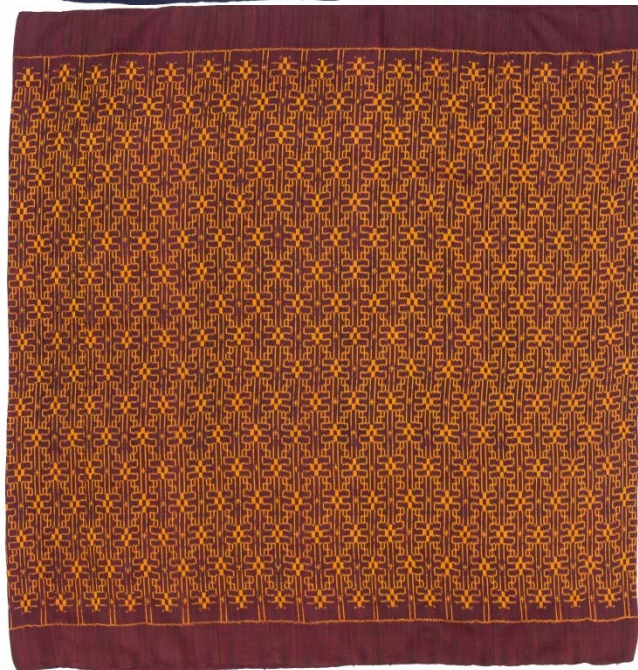
ลายประแจจีน