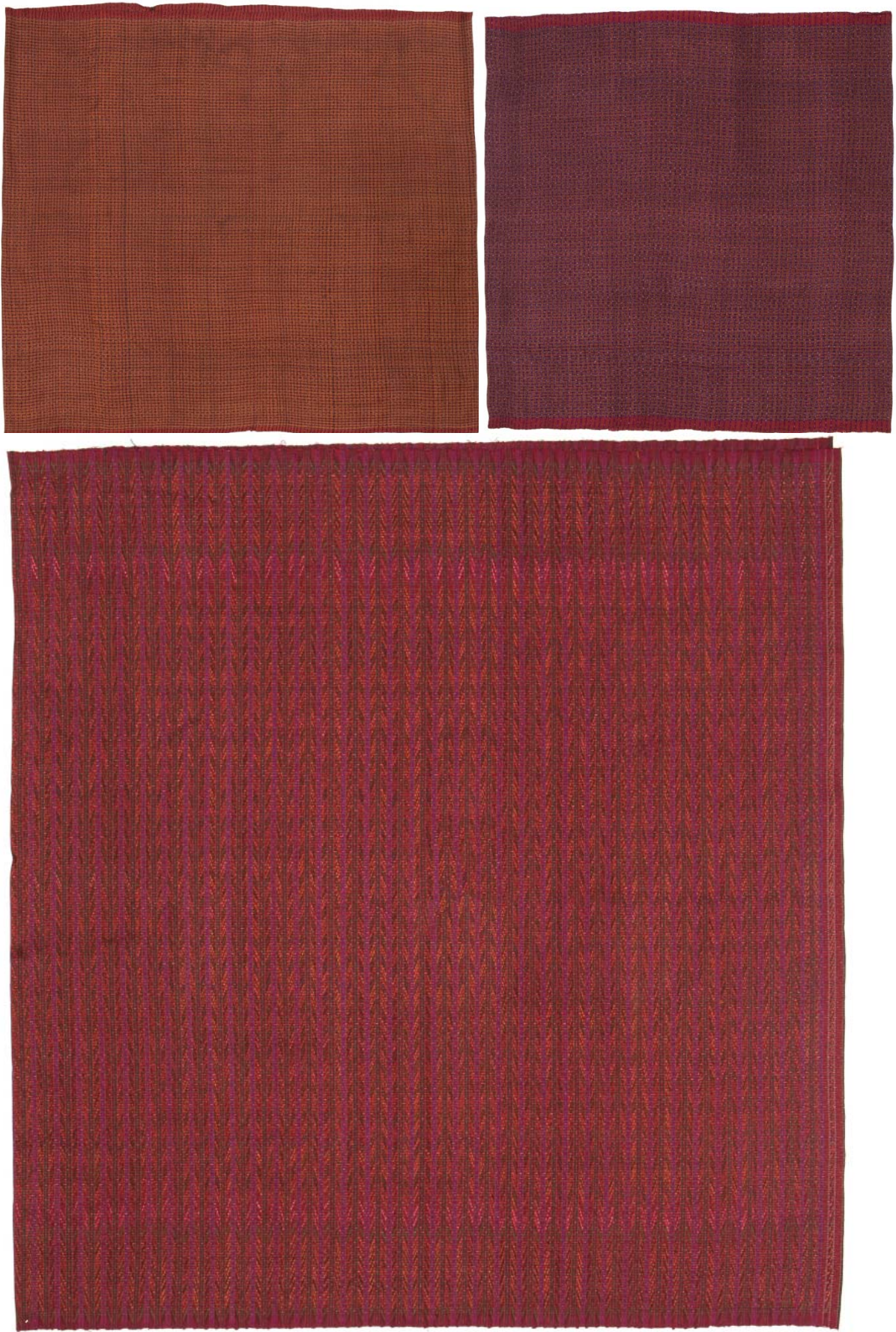
ผ้าอัมปรม