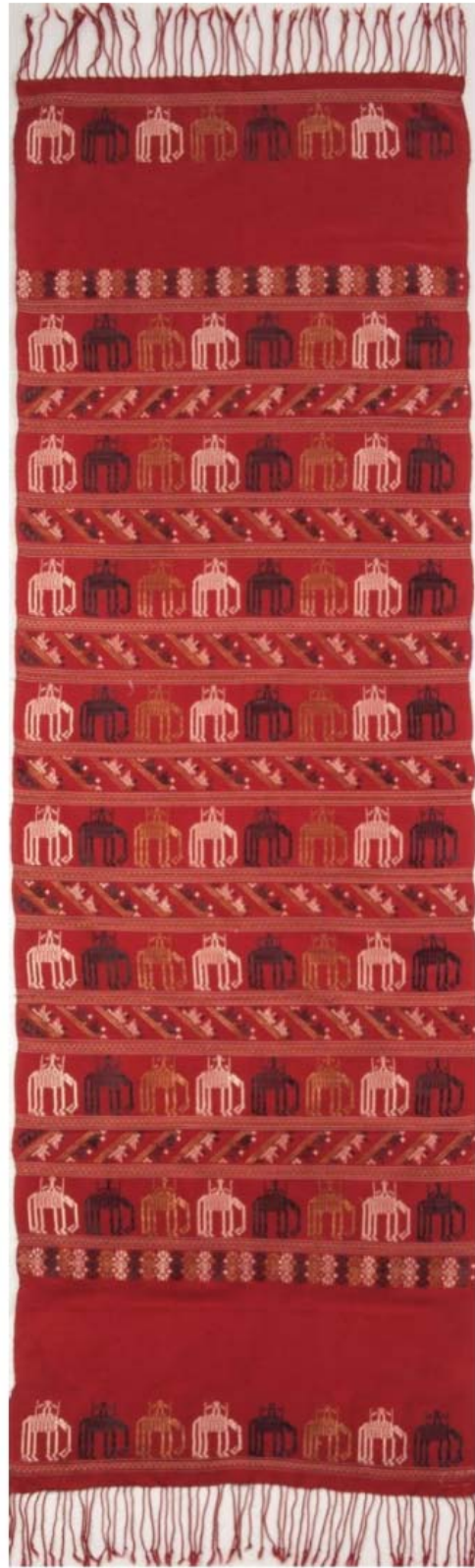
ผ้าเบี่ยง