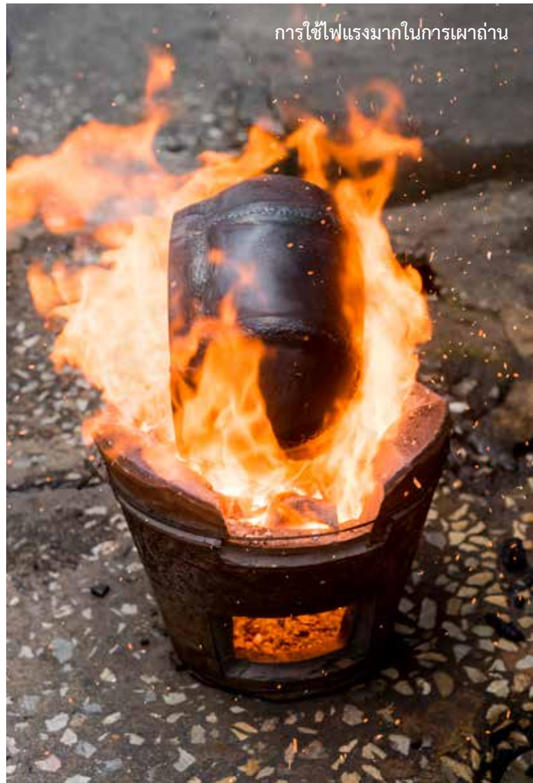
การใช้ไฟแรงมากในการเผาถ่าน

ช่างขึ้นรูปบาตรจึงต้องมีความชำนาญอย่างมาก โดยเฉพาะขั้นตอนการตัดเหล็กให้เป็นรูปกากบาทและกลีบบัว เพราะเป็นการตัดครั้งละลูกเท่านั้น แต่ละชิ้นต้องทำเครื่องหมายกำกับเพื่อง่ายต่อการนำมาติดขึ้นรูปกับขอบบาตร