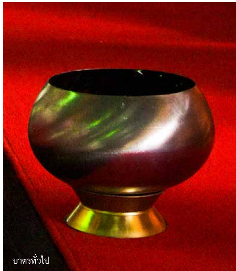
บาตรทั่วไป