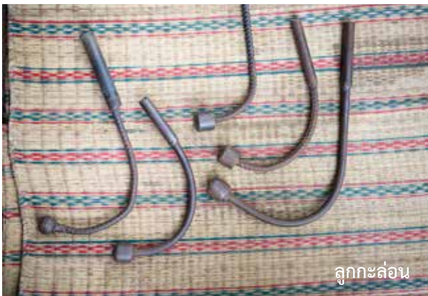
ลูกกะล่อน