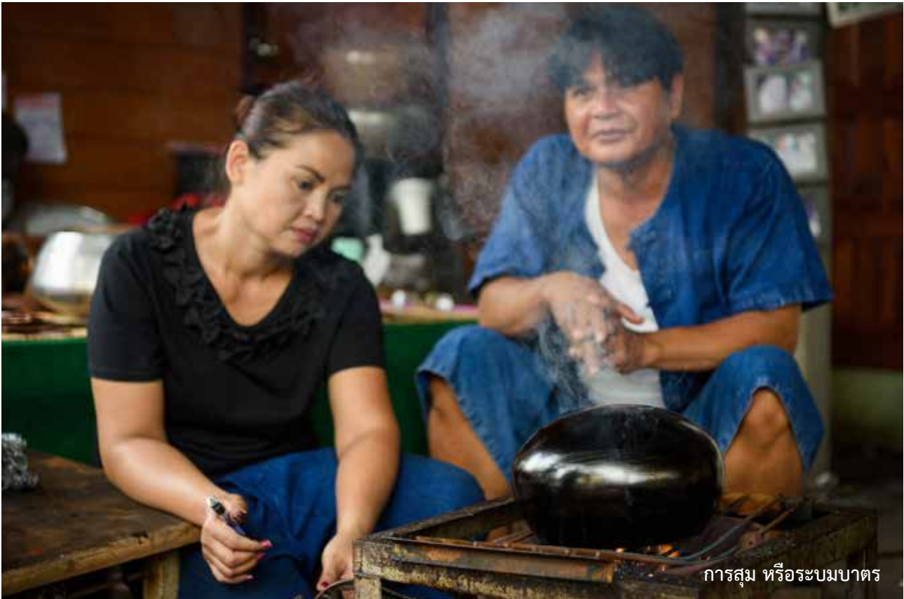
การสุม หรือระบมบาตร