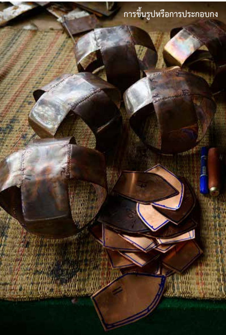
การขึ้นรูปหรือการประกอบกง