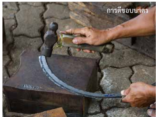
การตีขอบบาตร

การตีเชื่อมรอยต่อใช้เวลาราว 4-5 นาที ระหว่างตีต้องค่อยๆ ตัดโค้งเหล็กให้เป็นรูปพระจันทร์เสี้ยวเพื่อง่ายต่อการนำปลายทั้งสองด้านมาประกบ เหล็กที่ใช้ตีขึ้นรูปขอบบาตรใช้เหล็กซิงค์เบอร์ 20 (หนา 1 หุน กว้าง 6 หุน) เมื่อได้เหล็กแผ่นขนาดใหญ่มาก ช่างจะต้องนำมาซอยให้เหลือขนาด 20 x 20 นิ้ว เหล็กที่ใช้ตีขึ้นรูปขอบบาตรจะมีความหนาบางตามขนาดของบาตร ส่วนเหล็กที่ใช้ทำตัวบาตรก็จะบางลงไปตามความเหมาะสม เครื่องมือทุกอย่างในการทำบาตรบุเป็นเหล็กทั้งหมด ที่สำคัญคือเป็นอุปกรณ์โบราณที่ใช้สืบทอดกันมาตั้งแต่ครั้งโบราณ