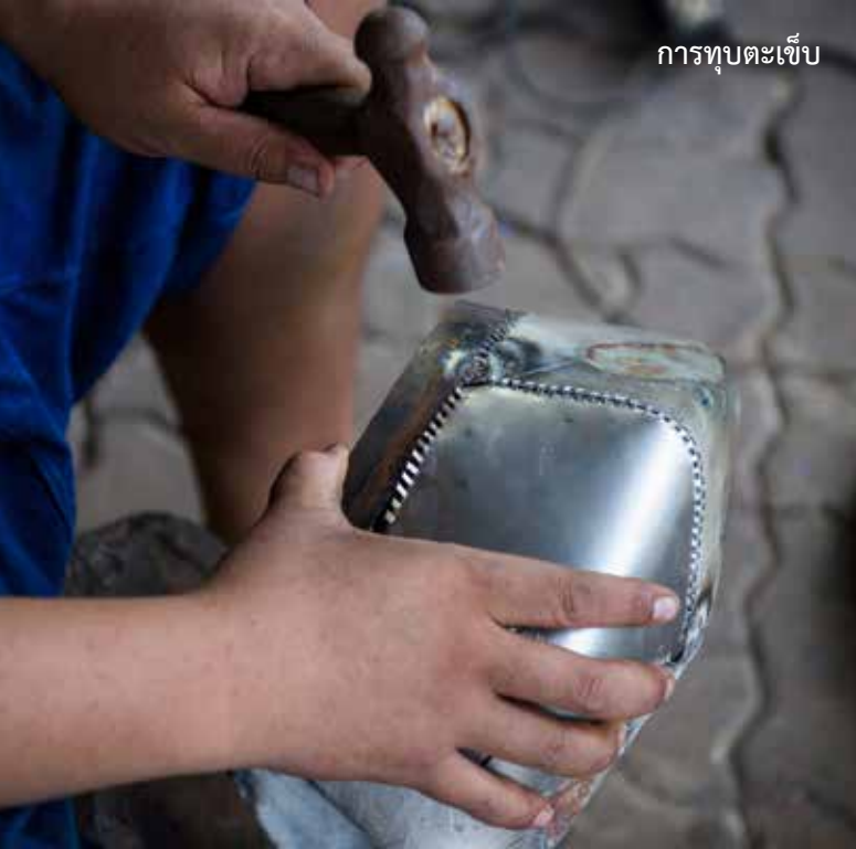
การทุบตะเข็บ